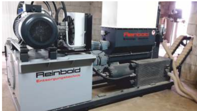
RB 600 RS in Siloausführung