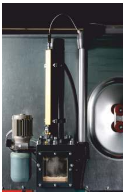
Wegemeßsystem zur Steuerung der Abläufe des Zylinders und der Pressmatrize. Daneben die Zentralschmieranlage