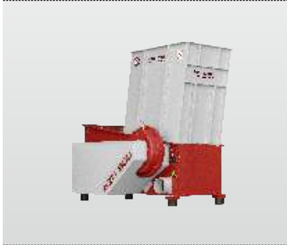
Baureihe AZR 600: der Universalzerkleinerer für Schreinereien