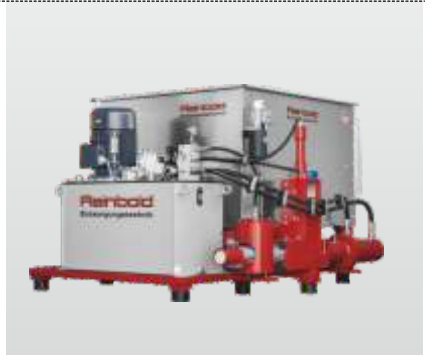
Baureihe RB 100 - RB 300 Flexibel S: zur Brikettierung von Materialspänen

Durch die langjährige Erfahrung in der Wertstoffzerkleinerung und Brikettierung kann Reinbold mit seinem umfangreichen Maschinenprogramm optimale Lösungen für die verschiedensten Anwendungen in der Zerkleinerung und Brikettierung bieten. Für Versuche mit Ihrem Material steht Ihnen unser Technikum zur Verfügung.