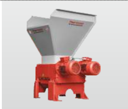
Baureihe RMZ 500 - RMZ 1000 S: der Vierwellenzerkleinerer, ideal zum Zerkleinern von langen Teilen