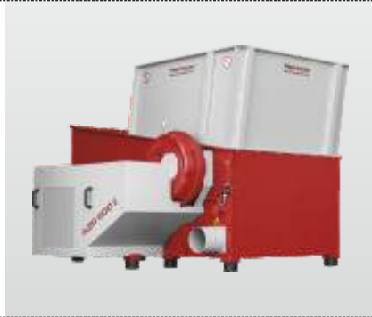
Baureihe AZR 800 - AZR 2000 Gigant: der Einwellenzerkleinerer für die professionelle Zerkleinerung