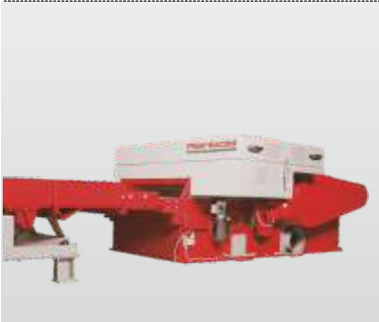
Baureihe RHZ 300 - RHZ 1300 Gigant: der Horizontalzerkleinerer für die horizontale Beschickung der Maschine