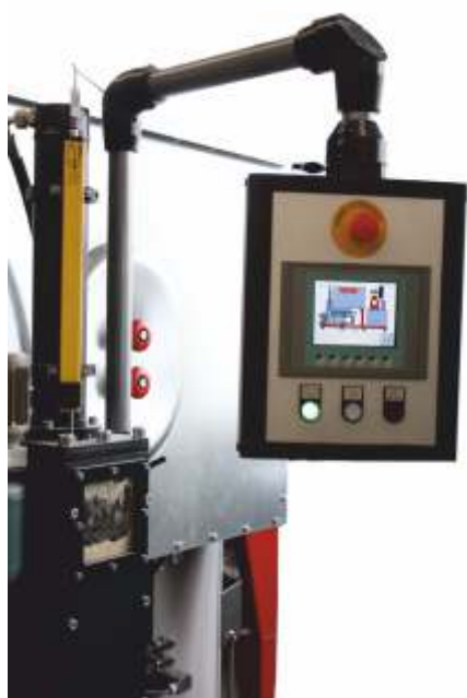
Kontrollpanel zur Steuerung und Programmierung der Brikettierpresse mittels Touch-Screen