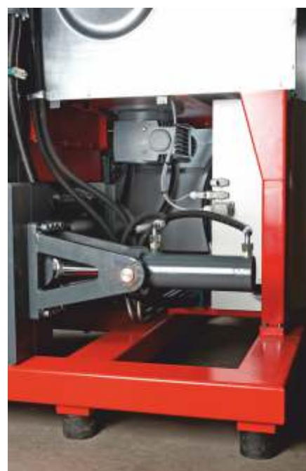
Leistungsstarke Hydraulikzylinder, Getriebemotor für das Rührwerk und die Förderschnecke