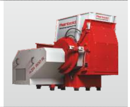
Baureihe AZR 600 K - AZR 2000 K Gigant: der Einwellenzerkleinerer für die effektive Kunststoffzerkleinerung