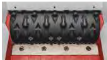
Rotor-Vers. 8 (couteaux Ø 30 mm)

* Nouveauté : Les rotors sont équipés avec des couteaux de dégagement Ø 30 x 16 mm version 8 afin d'assurer un broyage efficace sur toute la longueur du rotor