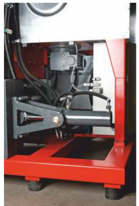
Leistungsstarke Hydraulikzylinder, Getriebemotor für das Rührwerk und die Förderschnecke