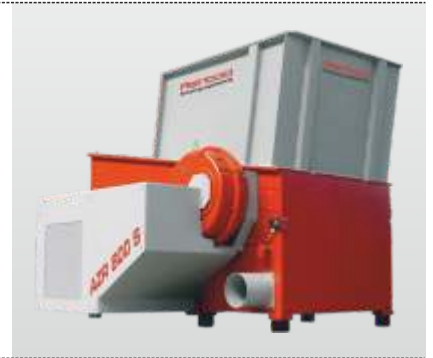
Baureihe AZR 800 - 2000 S Gigant: der Einwellenzerkleinerer für die professionelle Zerkleinerung