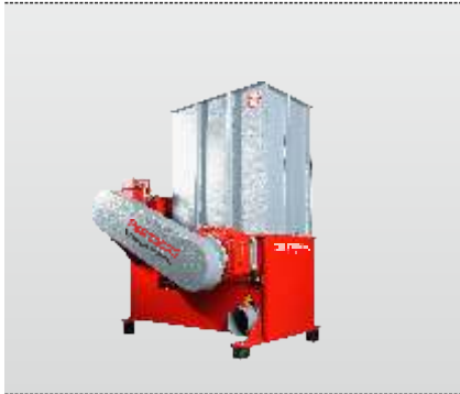
Baureihe AZR 50 Primus: das Einstiegsmodell in die Zerkleinerungs- technik mit Schubladenvorschub