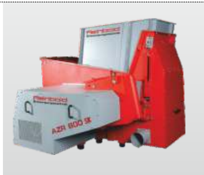
Baureihe AZR 600 K - 2000 K S Gigant: der Einwellenzerkleinerer für die effektive Kunststoffzerkleinerung