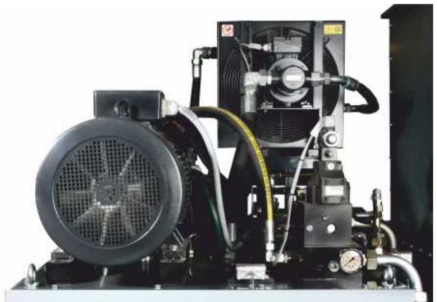
Hydraulikaggregat mit Axialkolbenpumpe und Kühlung für den Mehrschichtbetrieb

Die Brikettierpresse RB 400 RS – zuverlässige und leistungsfähige Brikettiertechnik für die industrielle Herstellung von eckigen Briketts zur Volumenreduzierung oder thermischen Verwertung. Die sehr gute Packdichte der eckigen Briketts ist optimal bei der Lagerung oder dem Transport. Außerdem haben die hochverdichteten Briketts ein sehr gutes Abbrandverhalten. Lassen Sie sich beraten, wie Ihr Material optimal brikettiert werden kann.