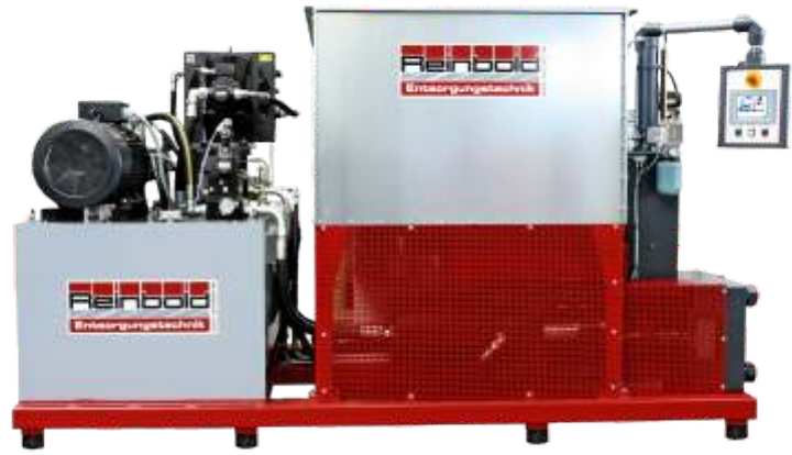
Option: stabiler Grundrahmen und Behälter