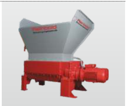
Baureihe RMZ 500 - RMZ 1000 S: der Vierwellenzerkleinerer, ideal zum Zerkleinern von langen Teilen

Durch die langjährige Erfahrung in der Wertstoffzerkleinerung und Brikettierung kann Reinbold mit seinem umfangreichen Maschinenprogramm optimale Lösungen für die verschiedensten Anwendungen in der Zerkleinerung und Brikettierung bieten. Für Versuche mit Ihrem Material steht Ihnen unser Technikum zur Verfügung.