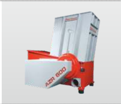
Baureihe AZR 600 - AZR 600 S: der Universalzerkleinerer für Schreinereien